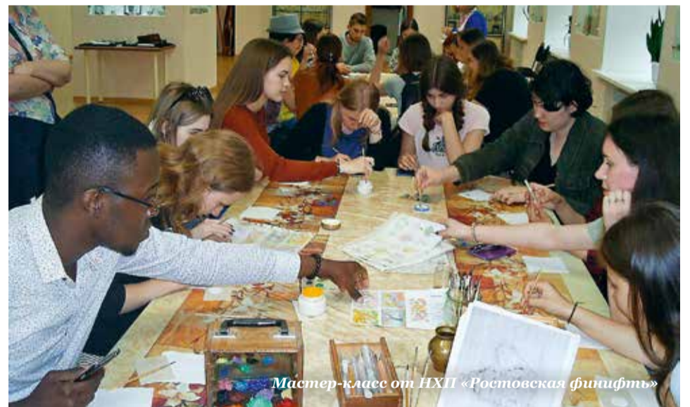
Мастер-класс от НХП «Ростовская финифть»