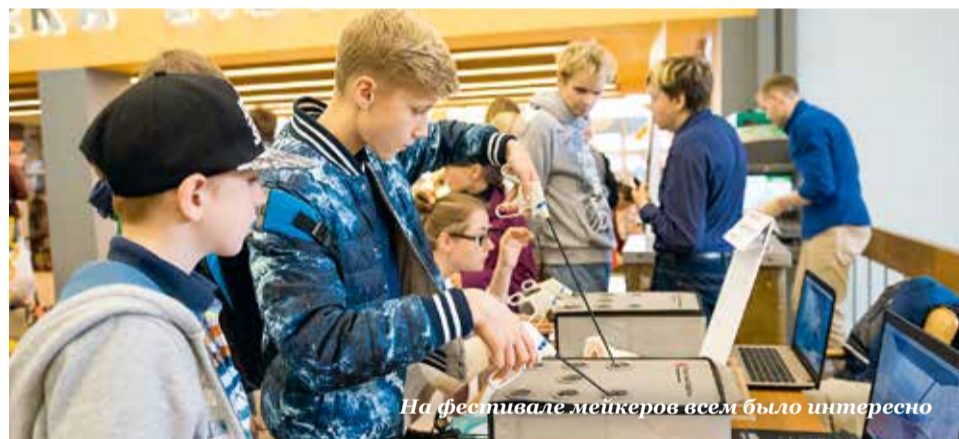
На фестивале мейкеров всем было интересно

Мейкерством он начал заниматься с 14 лет. – Какая у вас хорошая погода? Я живу в пустыне. Там сейчас 43 градуса.