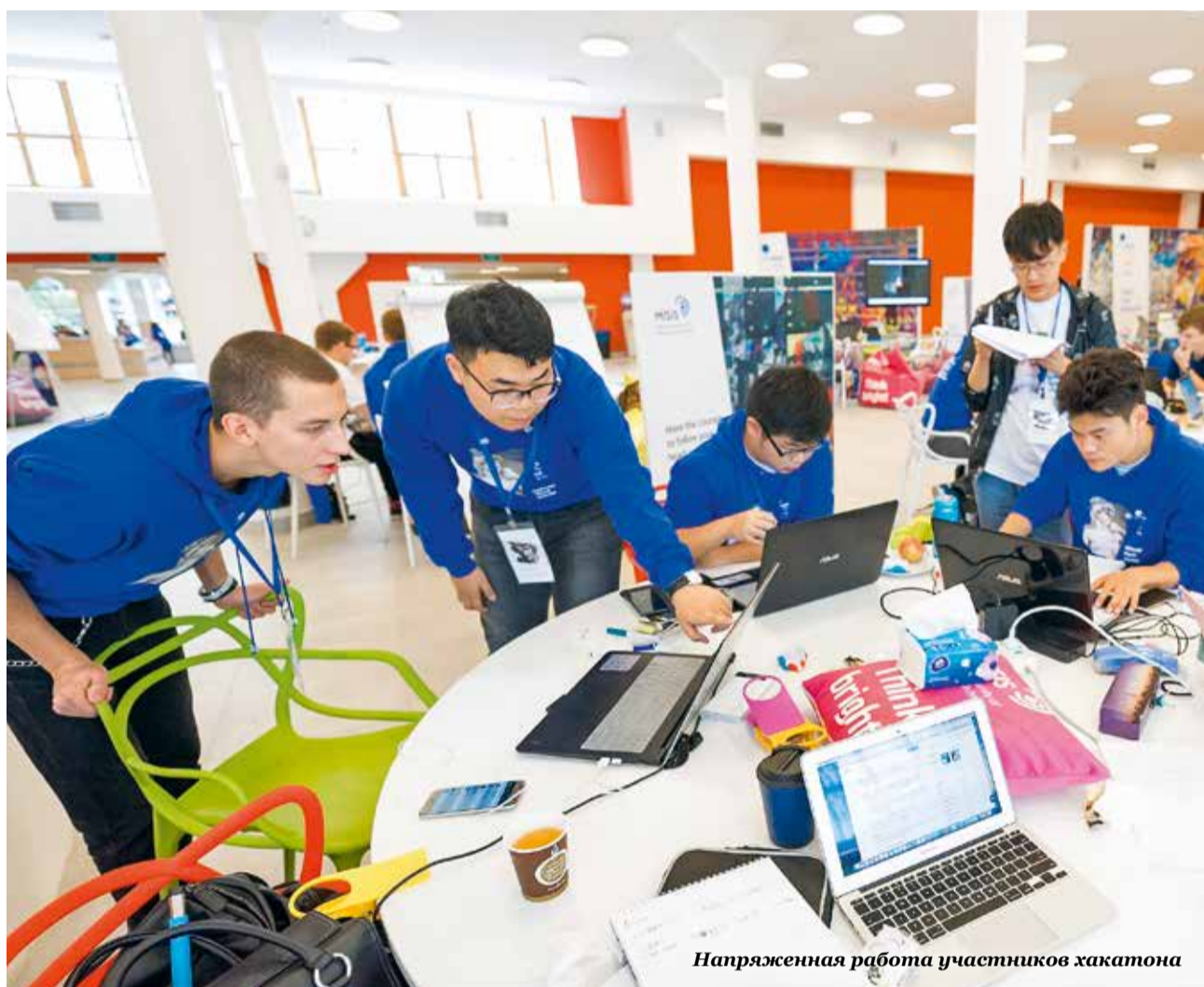
Напряженная работа участников хакатона

ФИЛ БЕЙТИ, ГЛАВНЫЙ РЕДАКТОР МЕЖДУНАРОДНОГО РЕЙТИНГА THE В УСЛОВИЯХ РАСТУЩЕЙ КОНКУРЕНЦИИ НА РЫНКЕ ВЫСШЕГО ОБРАЗОВАНИЯ УЛУЧШЕНИЕ ПОЗИЦИЙ НИТУ «МИСИС» В 2017 ГОДУ – СУЩЕСТВЕННОЕ ДОСТИЖЕНИЕ ДЛЯ УНИВЕРСИТЕТА И НАСТОЯЩИЙ ПОВОД ДЛЯ ПРАЗДНИКА